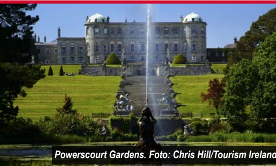
Powerscourt Gardens.