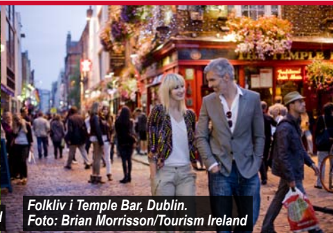
Folkliv i Temple Bar, Dublin.

den gamla vägen som så vackert ramar in halvön Iveragh. En naturlig start- och/eller slutpunkt för en tur är den omsjunga staden Killarney, naturskönt belägen vid Killarneysjöarna.