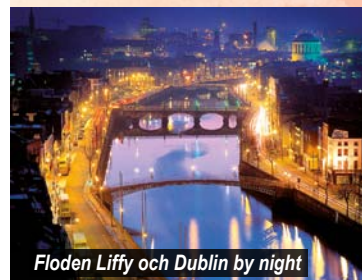
Floden Liffy och Dublin by night